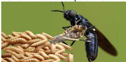
Gambar 1. Maggot Black Soldier Fly

Maggot yang merupakan larva lalat Black Soldier Fly (BSF) memang sangat istimewa dibandingkan bahan baku pakan alternatif lainnya karena mengandung nutrisi yang lengkap untuk ikan dan kualitas yang baik. Selain itu, Maggot bisa diproduksi dalam waktu singkat dan berkesinambungan dengan jumlah yang cukup untuk memenuhi kebutuhan pakan ikan.