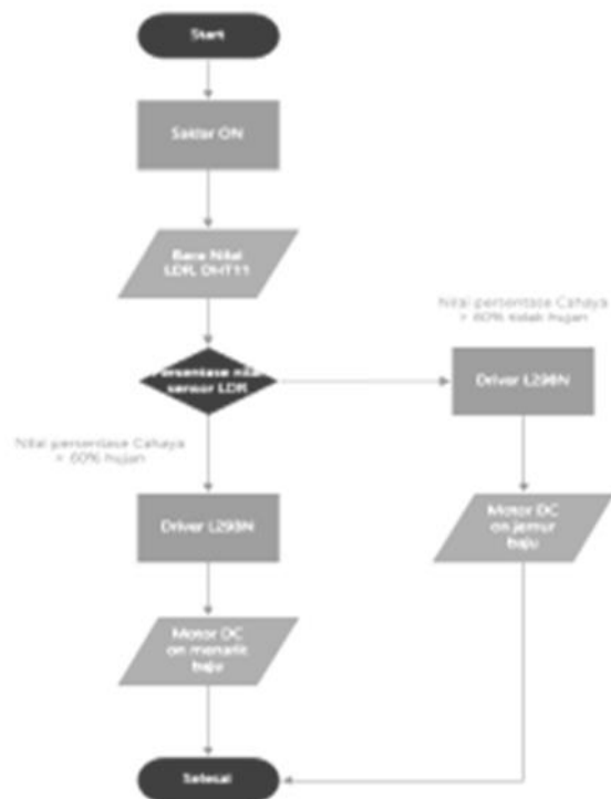
Gambar 2. Flowchart

Tahap paling pertama yang dilakukan dalam membuat suatu alat adalah bagaimana merancang suatu sistem yang akan diimplementasikan pada alat. Sebelum merancang sistem terlebih dahulu dibutuhkan flowchart atau diagram alur dari sistem yang akan dirancang tersebut. Flowchart sistem diperlihatkan pada Gambar 2 berikut.