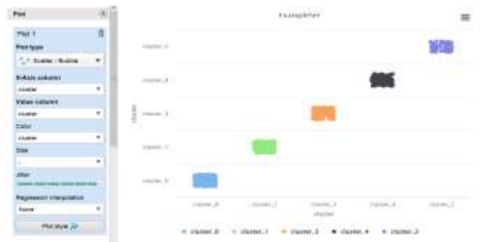
Gbr 6 Plot Data View Penyebaran Data Algoritma K-Medoids

Sedangkan untuk grafik Plot Data View berdasarkan cluster yang telah di tentukan di awal yaitu berjumlah 4 cluster dimana ada cluster 0, lalu cluster 1, juga ada cluster 2, kemudian cluster 3, dan cluster 4 maka grafik penyebaran data nya bisa diamati di Gbr 6.