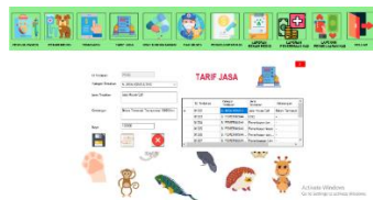
Gambar 6 Tampilan Form Tarif Jasa

Form tarif jasa proses penginputan data dari rincian tarif jasa yang sudah ditentukan oleh pihak klinik. Dalam form ini ada beberapa fungsi diantaranya menyimpan data, mengubah data, menghapus data dan mencari data dengan cara memilih salah satu yang ada di tabel sesuai kebutuhan pengguna.