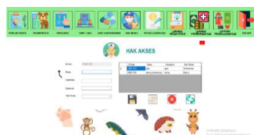
Gambar 8 Tampilan Form Hak Akses

Form hak akses termasuk proses inputan, form ini berfungsi untuk membuat username, password dan hak akses agar bisa masuk kedalam aplikasi ini. Form ini salah satu kunci dari keamanan sebuah aplikasi. Ada beberapa fungsi dari form ini yaitu menyimpan, mengubah, menghapus dan membatalkan perintah.