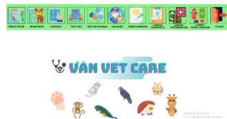
Gambar 2 Tampilan Form Menu Utama

Form menu utama ini berfungsi sebagai tampilan kedua ketika setelah login, dan tampilan yang paling utama dari semua form karena menu utama berisi kumpulan form-form yang ada didalam aplikasi.