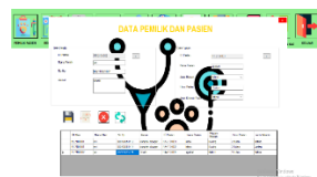
Gambar 3 Tampilan Form Data Pemilik

Form data pemilik dan pasien merupakan proses input data yang berkaitan dengan data-data pemilik dan pasien. Dalam form ini ada beberapa fungsi seperti tambah pemilik dan tambah pasien, menyimpan data, mengubah data, menghapus dan membatalkan perintah pengguna.