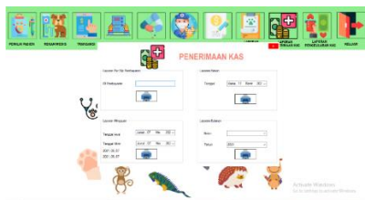
Gambar 9 Tampilan Form Laporan Penerimaan Kas

Form laporan penerimaan kas ini proses inputan untuk menampilkan output dari penerimaan kas berdasarkan, id pembayaran, harian, mingguan, atau bulanan.