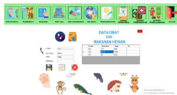
Gambar 7 Tampilan Form Obat dan Makanan

Form obat dan makanan merupakan proses inputan data obat dan makanan hewan, form ini berfungsi menyimpan data-data obat dan makanan hewan yang di khususkan sesuai dengan riwayat penyakit. Dalam form ini ada fungsi-fungsi seperti menambah data, mengubah data, dan menghapus data.