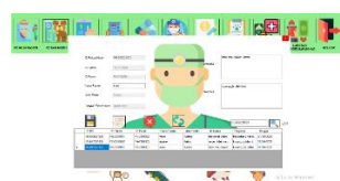
Gambar 4 Tampilan Form Rekam Medis

Form Rekam Medis dalam form ini ada proses input data untuk merekap data-data keluhan atau anamnesa dari pemilik terhadap hewan peliharaannya. Dalam form ini ada beberapa fungsi yaitu menyimpan data, mengubah data, menghapus data, membatalkan perintah dan mencari data rekam medis.