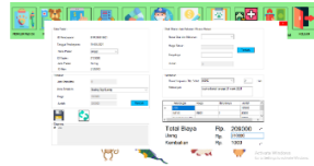
Gambar 5 Tampilan Form Transaksi

Form transaksi ini berfungsi untuk melakukan transaksi setelah merekap rekam medis dan diberikan tindakan perawatan terhadap hewan pemilik. Sehingga pemilik bisa membayar biaya dari perawatan ini. Dalam form transaksi ini ada beberapa fungsi diantaranya menambahkan biaya tindakan, menambahkan biaya obat dan makanan, menyimpan data, dan membatalkan perintah.