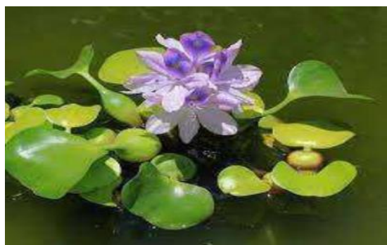
Gambar 1. Eceng gondok ( Eichhornia crassipes ) (Dadiono. M, 2017).

Pertumbuhan Eichornia crassipes yang sulit dikendalikan menimbulkan dampak yang kurang menguntungkan. Eichornia crassipes bisa berkembang biak dengan cepat. Setiap sepuluh tanaman berkembang biak menjadi 600.000 tanaman dalam waktu kurang lebih 8 bulan. Gulma ini bisa tumbuh di daerah perairan yang tercemar oleh limbah, yang mana limbah tersebut merupakan salah satu upaya penyuburan yang secara sengaja maupun tidak sengaja. (Afriyanto, 1989).