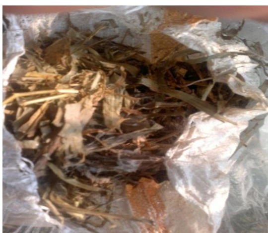
Gambar 5. Hasil pencacahan dengan mesin lama