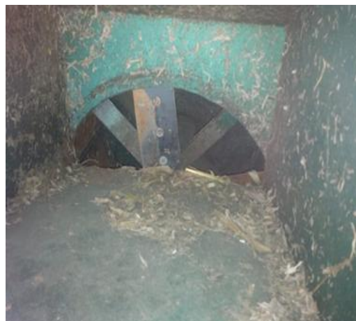
Gambar 1. Konstruksi pisau mesin pencacah lama

Kelompok Tani Ternak Mekar Mandiri ini sudah memiliki satu unit mesin pencacah. Susunan mata pisau dari mesin pencacah yang lama ini berbentuk radial berputar, sebagaimana terlihat pada Gambar 1. Potongan yang dihasilkan masih terlalu besar. Oleh karenanya mesin tersebut saat ini tidak difungsikan. Selain itu, karena saat mesin dihidupkan suaranya keras, mengakibatkan banyak sapi yang terganggu dan stress.