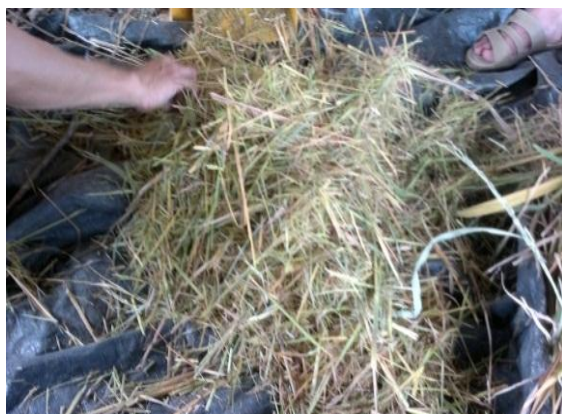
Gambar 4. Hasil pencacahan dengan mesin baru

berhenti bila digunakan untuk mencacah lebih dari 0,5 kg jerami sekaligus.