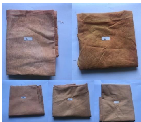
Gambar 3. Pewarnaan kain dengan zat warna akar mengkudu ekstraksi batch pemanasan

Uji tahan luntur sangat penting di bidang