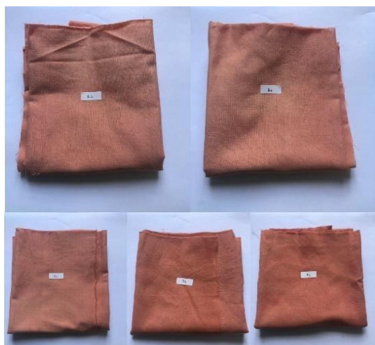
Gambar 4. Pewarnaan kain dengan zat warna akar mengkudu ekstraksi maserasi

tekstil, karena dapat menilai ketahanan warna hasil pencelupan, keawetan warna yang dihasilkan, dan juga sebagai dasar pengambilan keputusan pemilihan zat warna yang digunakan berdasarkan kestabilan warna yang dihasilkan. Parameter-parameter ini tentu akan memengaruhi kesimpulan kualitas dari proses pewarnaan kain.