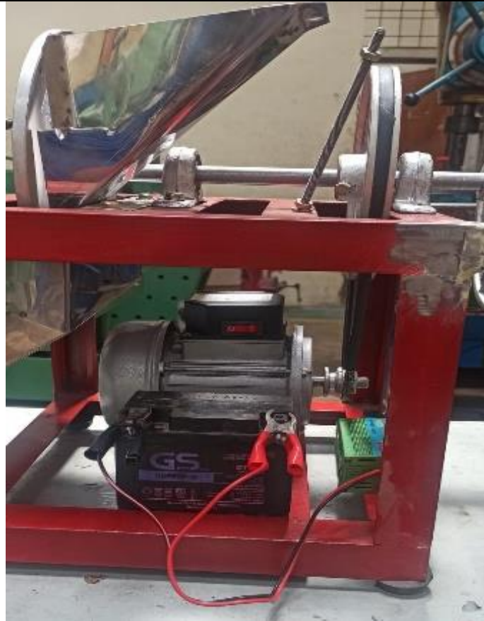
Gambar 4. Mesin Pencacah Bawang Tenaga Hybrid

Kelebihan dari mesin tenaga hybrid ini yaitu mampu menggunakan sumber listrik selain dari PLN. Hal ini berguna ketika mesin akan digunakan di lokasi yang jauh dari sumber listrik. Ketika akan digunakan di lokasi yang jauh dari sumber listrik, mesin masih mampu beroperasi dengan menggunakan sumber tenaga dari accumulator (aki). Secara garis besar kelebihan mesin pencacah bawang merah dan bawang bombay dengan tenaga hybrid ini yaitu mampu beroperasi pada lokasi yang jauh dari sumber listrik, dengan bantuan dari accumulator (aki).