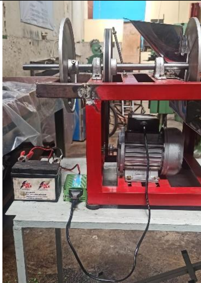
Gambar 3. Hasil Perakitan Untuk Sistem Listrik Dari Accumulator

Gambar 3 merupakan hasil dari perakitan sistem kelistrikan untuk sumber listrik dari accumulator (aki). Pengujian dilakukan untuk mengetahui apakah sistem kelistrikan yang dirancang dan dirakit sudah berfungsi dengan baik atau tidak. Hasil pengujian menunjukkan bahwa mesin mampu beroperasi dengan baik. Pengujian dilakukan menggunakan sumber listrik PLN dan accumulator, hasilnya mesin mampu beroperasi baik dengan menggunakan PLN atau accumulator.