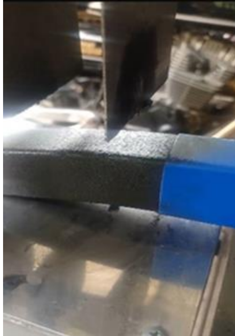
Gambar 8. Proses Pencetakan Arang Briket

Pada proses kelima ini arang yang sudah dimasukkan ke dalam corong penampung akan keluar ke cetakan arang. Berikut merupakan gambar proses pencetakan, dapat dilihat pada Gambar di bawah ini.