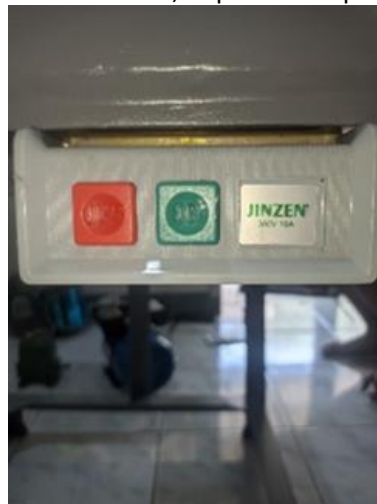
Gambar 3. Spesifikasi Saklar

Berikut merupakan gambar spesifikasi saklar, dapat dilihat pada Gambar di bawah ini.