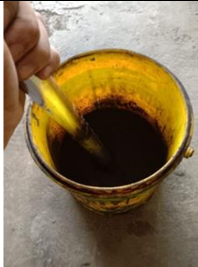
Gambar 4. Penghancuran Bahan Baku