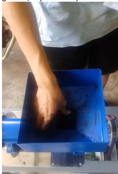
Gambar 7. Pemasukan Bahan Baku

Pada proses keempat ini melakukan pemasukan serbuk arang yang sudah dicampur dengan tepung tapioka lalu dimasukkan ke dalam corong penampung mesin pencetak arang briket untuk dipadatkan menggunakan sistem spiral yang ada di dalam silinder. Berikut merupakan gambar pemasukan bahan baku arang briket, dapat dilihat pada Gambar di bawah ini.