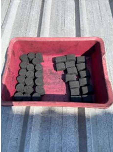
Gambar 10. Pengeringan Arang Briket

Setelah proses pencetakan dan pemotongan selesai, arang briket yang sudah terbentuk masih mengandung kadar air yang lebih tinggi. Untuk mengurangi kadar air dan meningkatkan kepadatan arang briket maka dapat dilakukan proses pengeringan secara alami dengan paparan udara terbuka ataupun oven pengering. Berikut merupakan gambar proses pengeringan, dapat dilihat pada Gambar di bawah ini.