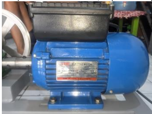
Gambar 2. Tabel Spesifikasi Motor Listrik

Berikut merupakan gambar tabel spesifikasi motor listrik, dapat dilihat pada Gambar di bawah ini.