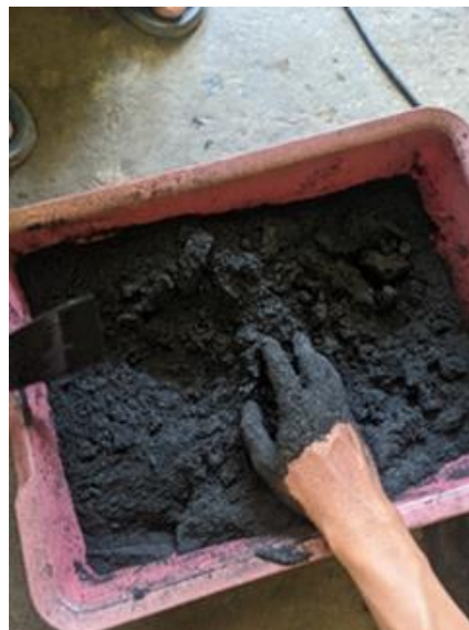
Gambar 5. Pencampuran Bahan Baku

Pada proses kedua bahan baku arang yang telah dihancurkan menggunakan proses manual kemudian arang yang sudah disaring menjadi halus dicampurkan dengan bahan perekat atau bahan pengikat lainnya seperti tepung tapioka. Berikut merupakan gambar proses pencampuran bahan baku, dapat dilihat pada Gambar di bawah ini.