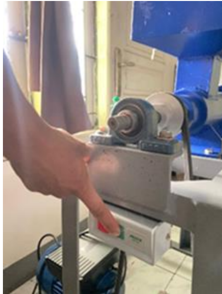
Gambar 6. Proses Penghidupan Mesin