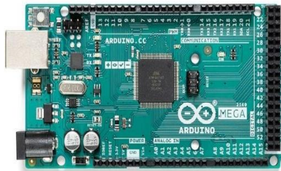
Gambar 2. Arduino Mega 2560

Arduino dan Fungsinya Arduino adalah pengendali mikro berbasis papan tunggal yang dirancang untuk memudahkan pengembangan perangkat elektronik. Sebagai proyek perangkat lunak sumber terbuka, Arduino mendukung integrasi perangkat keras dan perangkat lunak yang fleksibel dan mudah digunakan. Fungsi utamanya adalah menyederhanakan penggunaan elektronik dalam berbagai aplikasi, seperti otomasi, pendidikan, hingga prototipe perangkat elektronik interaktif. (Developer, 2020).