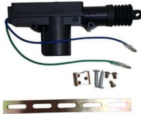
Gambar 5. Solenoid DoorLock

Solenoid door lock adalah solenoid yang dirancang khusus untuk mengunci pintu secara elektronik . Solenoid ini memiliki dua jenis sistem kerja, yaitu Normally Close (NC) dan Normally Open (NO). Perbedaan utama terletak pada cara kerjanya, NC akan menutup (memanjang) saat diberi tegangan, sedangkan NO akan membuka (memendek) saat diberi tegangan. Kebanyakan solenoid door lock bekerja pada tegangan 12V DC, namun ada juga yang menggunakan 5V DC. Untuk solenoid 12V DC, diperlukan catu daya 12V dan relay . (Resanata, 2022).