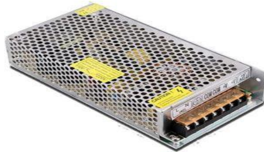
Gambar 1. Power Supply

tersebut menjadi lebih besar. Dengan sebuah adaptor tidak lagi dibutuhkan baterai tetapi kelemahannya tidak dapat dibawa-bawa dengan mudah karena adaptor harus selalu tersambung ke jaringan listrik PLN (Wiki, 2022).