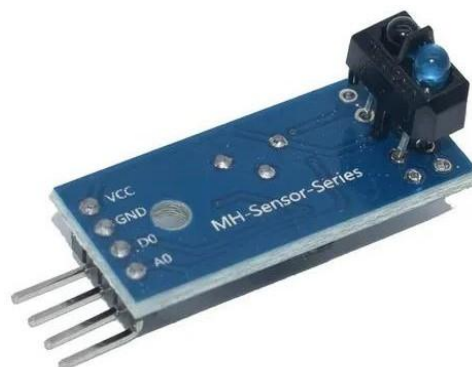
Gambar 4. Sensor TCRT5000

Sensor inframerah inovatif yang menggabungkan pemancar IR dan fototransistor untuk menyaring cahaya tampak secara efektif, meningkatkan deteksi objek melalui pantulan cahaya IR. Ketepatannya dalam memfokuskan pada panjang gelombang inframerah menjadikannya pilihan yang andal untuk berbagai aplikasi, memenuhi tuntutan akan keakuratan dan keandalan dalam teknologi. Fungsionalitas yang diperluas dari varian TCRT5000L lebih jauh memenuhi permintaan yang terus meningkat akan kemampuan penginderaan tingkat lanjut, memperluas potensi aplikasi sensor serbaguna ini. (Allelco, 2020).